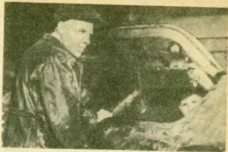
Главный конструктор КБ у конвейера сборки танка Т-34 в первые месяцы войны

казывая образцы героизма, коммунисты. В выполнение обязательств свой вклад вносили все: технологи, оснащавшие станки и агрегаты высокопроизводительными приспособлениями; ученые из Института электросварки Академии наук УССР во главе с Е. О. Патонем, которые впервые в мировой практике внедрили автоматическую сварку броневой стали, повысив производительность труда на сварке корпусов в восемь раз; заводские комсомольцы, решившие построить сверхплановую танковую колонну.